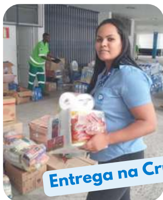
Entrega na Cruz Vermelha