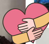
Nova etapa de doação no SESC